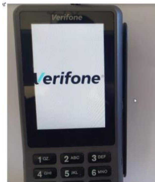
Slik ser display ut når ECR er tilkoblet.

VENTER PÅ KASSETILKOBLING (ECR CONNECTION)