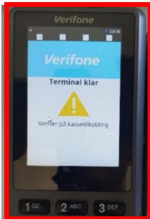
Når terminalen ikke har kontakt med kasse